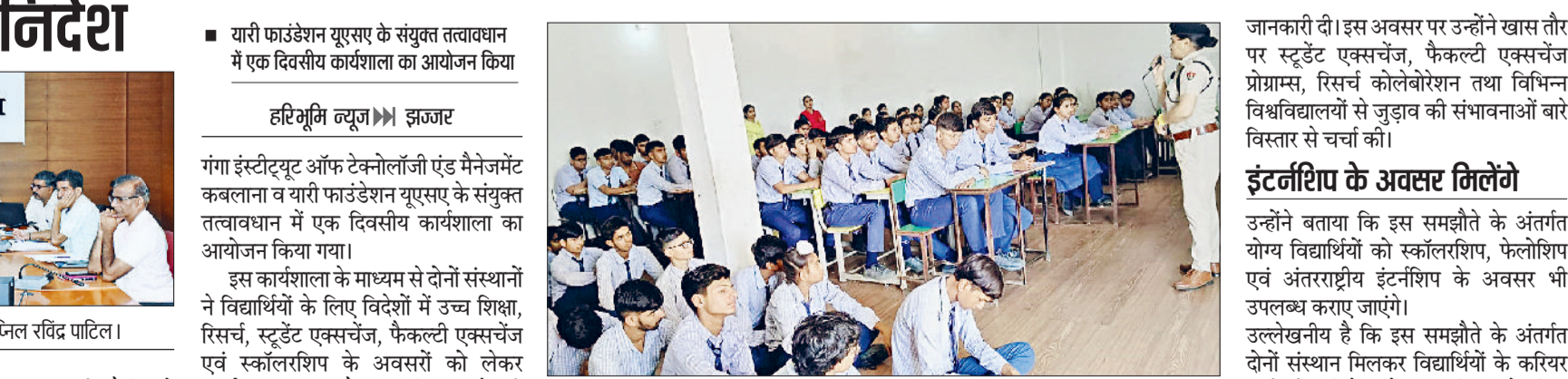
झज्जर। कार्यशाला में उपस्थित शिक्षक एवं विद्यार्थी।