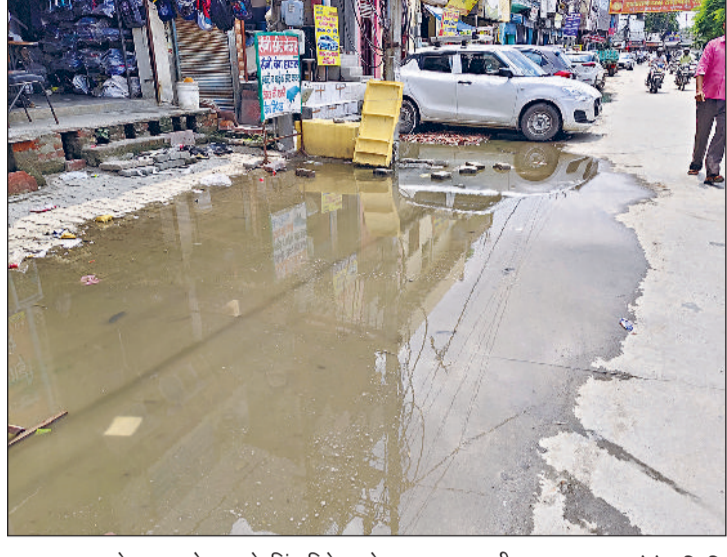
बहादुरगढ़। पुराने झज्जर रोड पर लेवलिंग डिफेक्ट के कारण जमा पानी।

नगर परिषद के अधिकारियों ने पुराने झज्जर रोड पर सड़क के साथ ही इंटरलॉकिंग टाइल्स लगावाई थी