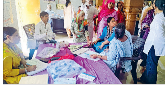
झज्जर। स्वास्थ्य जांच शिविर में उपस्थित चिकित्सक एवं ग्रामीण।

टीबी मुक्त भारत अभियान के अंतर्गत क्षेत्र के गांव लाडपुर में दो दिवसीय निक्षय शिविर का आयोजन किया गया। कार्यवाहक सिविल सर्जन डॉक्टर टीएस बागड़ी ने बताया कि टीबी मुक्त भारत अभियान को आगे बढ़ाने के लिए आमजन को आगे आना