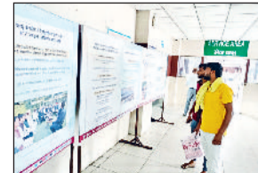
झज्जर। लघु सचिवालय परिसर में चल रही प्रदर्शनी का अवलोकन करते नागरिक।

आपातकाल की लोकतंत्र विरोधी ऐतिहासिक घटनाओं से रूबरू हो रहे नागरिक झज्जर। लोकतंत्र और संविधान की महत्ता को उजागर करने तथा आमजन को आपातकाल की लोकतंत्र विरोधी ऐतिहासिक घटनाओं से अवगत कराने के उद्देश्य से लघु सचिवालय में विशेष जन-जागरूकता प्रदर्शनी से आमजन न केवल जागरूक हो रहे हैं, साथ ही प्रदर्शनी के माध्यम से उन्हें आपातकाल के काले अध्याय की जानकारी भी मिल रही है। डीआईपीआरओ सतीश कुमार ने बताया कि दस दिवसीय प्रदर्शनी के माध्यम से लोग आपातकाल की लोकतंत्र विरोधी ऐतिहासिक घटनाओं से रूबरू हो रहे हैं।