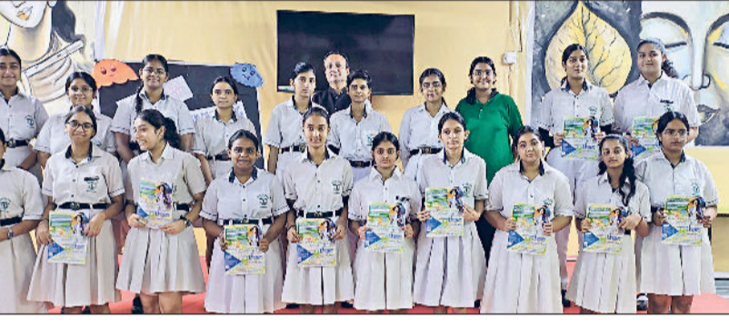
बहादुरगढ़। करियर काउंसलिंग सत्र में भाग लेते डीपीएस के विद्यार्थी।