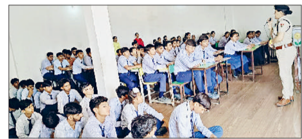
झज्जर। विद्यार्थियों को जागरूक करते हुए पुलिसकर्मी।

कहा कि सरकार भी महिलाओं को स्वावलंबी बनाने के लिए लगातार प्रयास कर रही है। उन्होंने कहा कि गांव डीघल में महिला सांस्कृतिक केंद्र खुलने से महिलाओं को इसका पूरा लाभ मिलेगा।