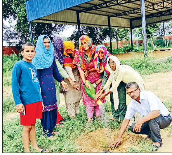
झज्जर। खेल स्टेडियम में पौधारोपण करते हुए ग्रामीण एवं ट्रस्ट सदस्य।

आपातकाल की लोकतंत्र विरोधी ऐतिहासिक घटनाओं से रूबरू हो रहे नागरिक झज्जर। लोकतंत्र और संविधान की महत्ता को उजागर करने तथा आमजन को आपातकाल की लोकतंत्र विरोधी ऐतिहासिक घटनाओं से अवगत कराने के उद्देश्य से लघु सचिवालय में विशेष जन-जागरूकता प्रदर्शनी से आमजन न केवल जागरूक हो रहे हैं, साथ ही प्रदर्शनी के माध्यम से उन्हें आपातकाल के काले अध्याय की जानकारी भी मिल रही है। डीआईपीआरओ सतीश कुमार ने बताया कि दस दिवसीय प्रदर्शनी के माध्यम से लोग आपातकाल की लोकतंत्र विरोधी ऐतिहासिक घटनाओं से रूबरू हो रहे हैं।